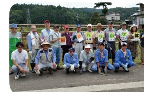
新潟妙高高原・稲刈り体験ツアー

会員同士が気軽に楽しみながら、親睦をより深めてもらおうとの趣旨でエンターテインメント委員会を新たに発足させました。年に4~6回程度、催事(施設・工場・展示会などの見学会)を企画します。