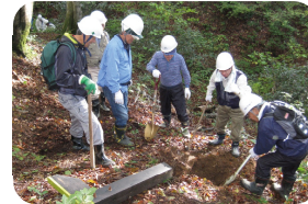
十日町市での活動の様子

将来的には、他の地域の環境保全、高齢者・障害者支援、小・中学校への出前授業なども計画しています。